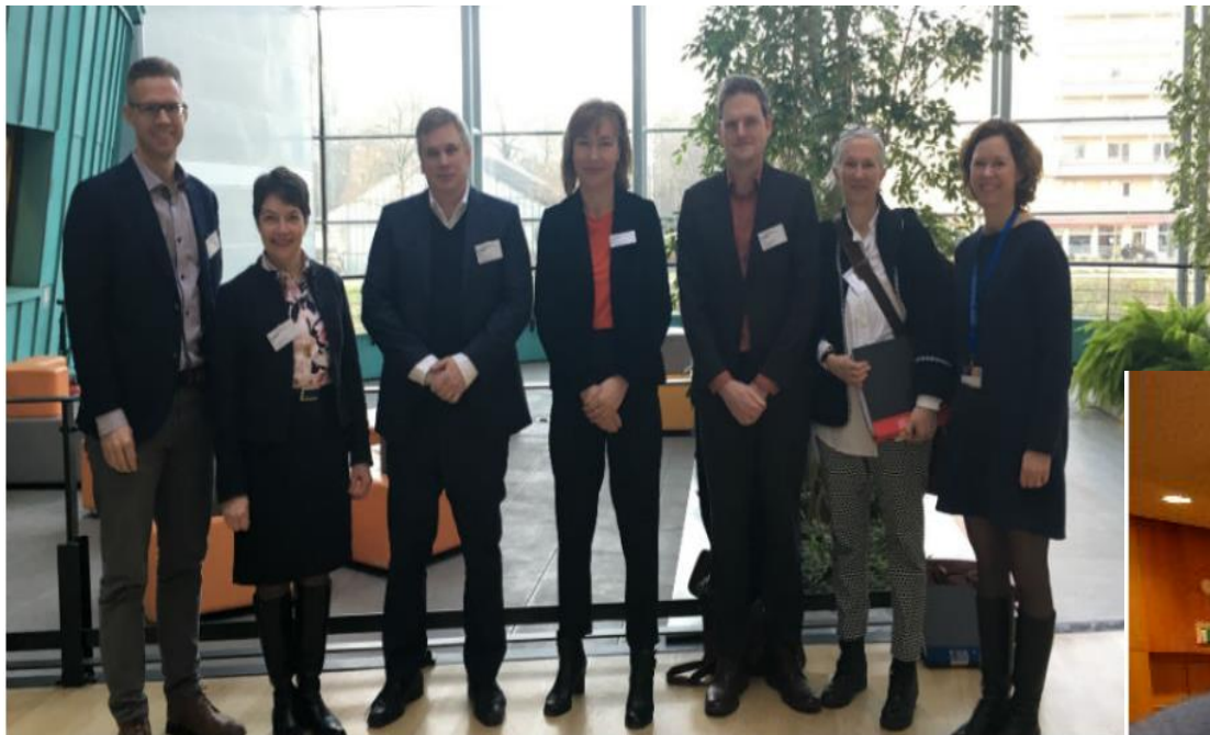
Strasbourg 21 februari 2018