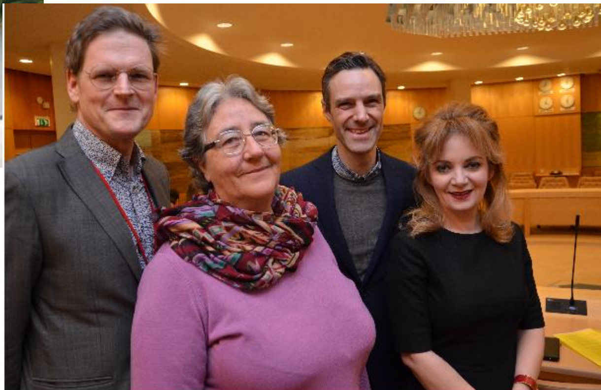
Stockholm 26-29 mars 2018