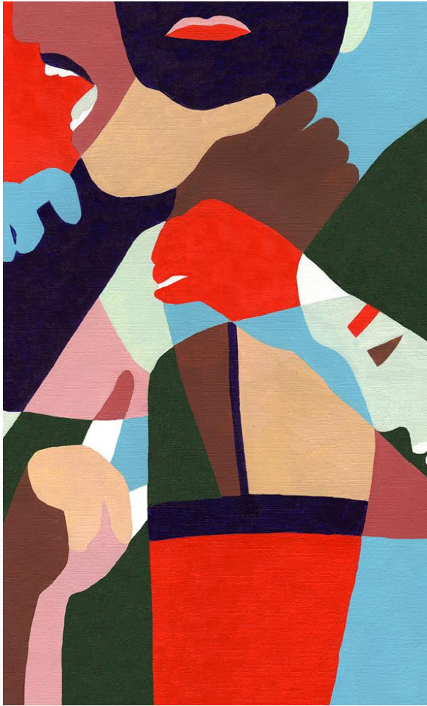
Painting: Inès Longevial