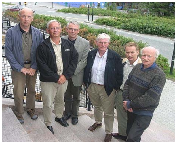
Arrangementskomiteen.