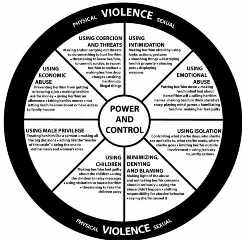
Figur 1 –MAKT OG KONTROLL-HJULET